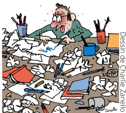
Dessin de Charlie Zanello