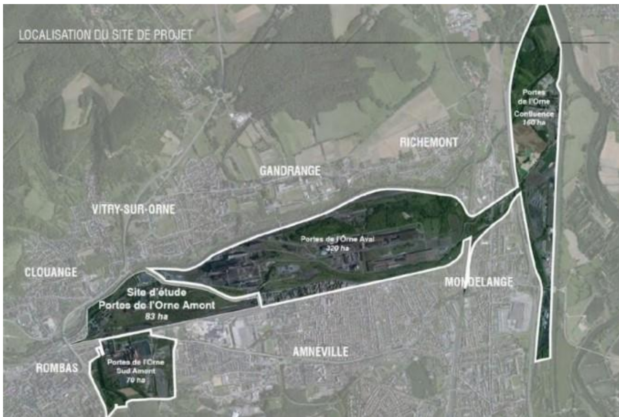
Organisation du site des Portes de l'Orne

L'objet du présent appel à projet est le bâtiment dit ASSERPRO. Il se trouve au sein du premier secteur opérationnel de 104 ha des « Portes de l'Orne Amont », entièrement situé sur le territoire de la CCPOM.