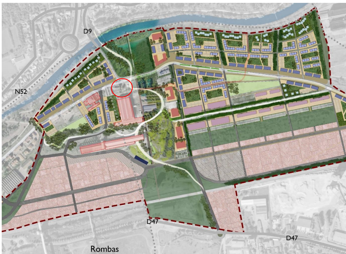
Situation du bâtiment ASSERPRO (29 rue de l'Usine) sur les Portes de l'Orne

Le bâtiment situé au 29 rue de l'Usine à Rombas était, jusqu'à l'automne 2023 propriété d'ASSERPRO (association pour l'emploi par la réinsertion professionnelle). Les parcelles concernées sont les n°151 et n°471 de la section 18 présentant une surface au sol de plus de 2 000 m 2 . La parcelle n°151 est bâtie ; elle accueille un ensemble de locaux, dits « sociaux » désaffectés de la plateforme UNIMETAL, convertis à l'usage d'ateliers et de centre de réinsertion professionnelle. Aux abords du bâtiment, on dénombre une quinzaine d'emplacements de parking en asphalte.