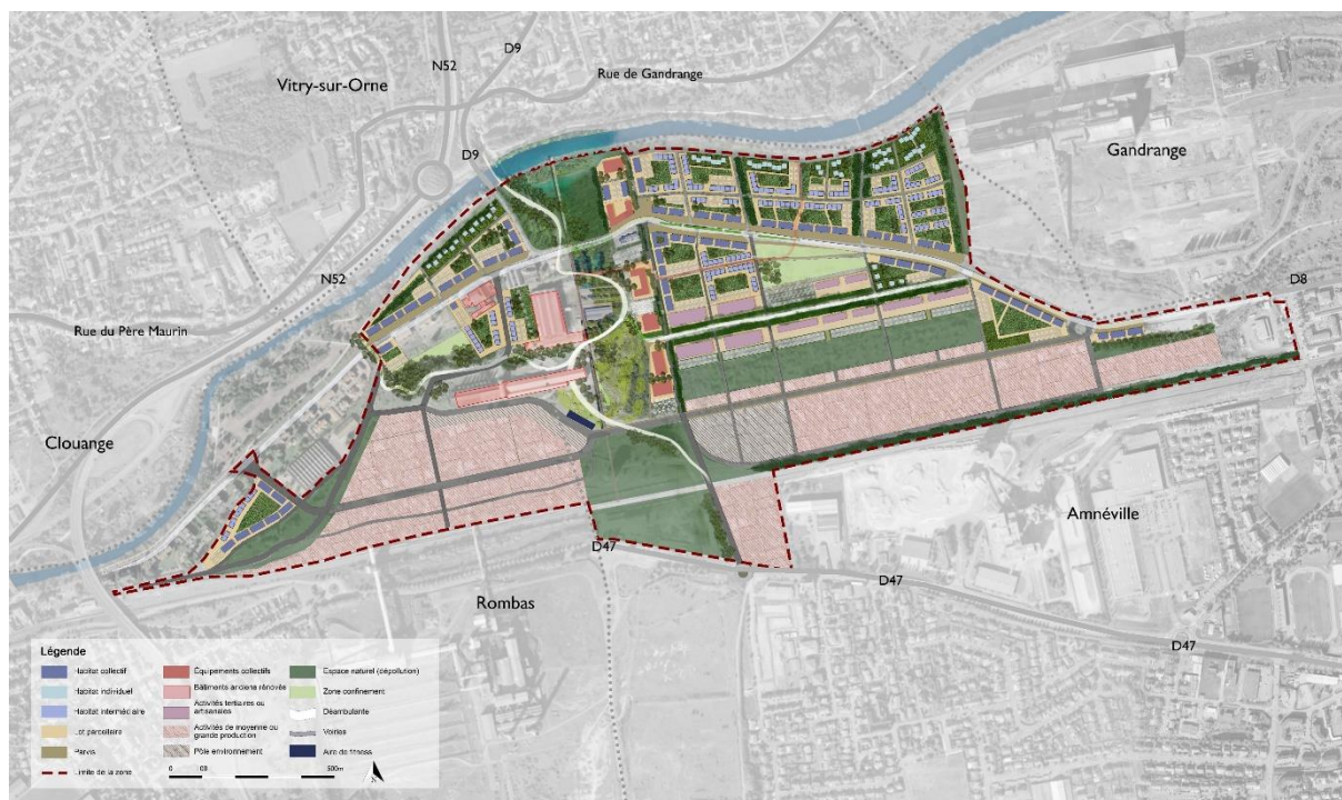
Schéma d'aménagement projeté des Portes de l'Orne amont

Le projet des Portes de l'Orne est mis en œuvre dans le cadre d'un étroit partenariat avec l'Etablissement Public Foncier Grand Est (EPFGE). Depuis 2013, plusieurs études ont été réalisées pour définir et détailler le projet de développement et d'aménagement du site. Le SMEAPO s'est fixé un objectif ambitieux de « faire des Portes de l'Orne la vitrine d'un site d'expérimentation pour inventer la ville de demain, à la fois plus humaine et plus écologique, qui soit tournée vers l'innovation au service du vivre ensemble ».